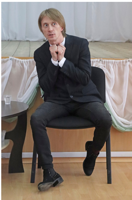
Актёр всегда готов к перевоплощению

– Я родился в Петрозаводске в 1985 году, мне 37 лет. Окончил 13-й лицей. В 16 лет поступал в Национальный театр. Туда я благополучно принят не был. Страшно расстроился и пошёл работать официантом. Через год поступил в музыкальный колледж имени Раутио, учился на вокале три года. Ушёл. Пробовал поступать на театральный несколько раз. Поступил только с четвёртого раза, попал в донатор. Экстерном сдавал первый и второй год. Моим однокурсникам не было ещё 20, а мне – 23. Это было относительно поздно. На театральных отделениях не очень любят взрослых парней и девушек. Чем человек старше, тем он более оформленный и закрытый. Его сложнее обучать вещам, кото-